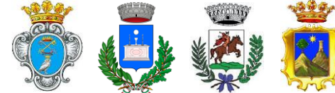
Associazione dei comuni di Galatina, Aradeo, Cutrofiano e Neviano

Via Montegrappa n. 8, 73013 Galatina (LE)